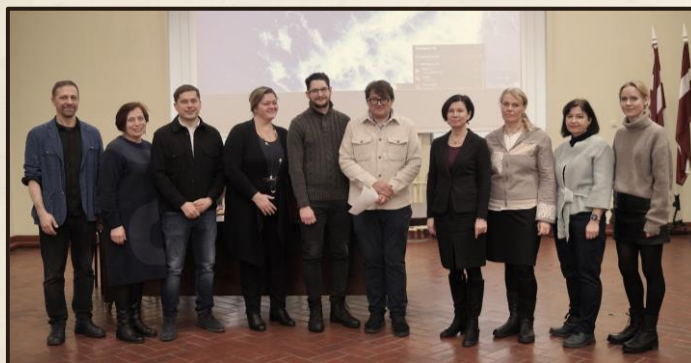
LRB jaunievēlētā valde.