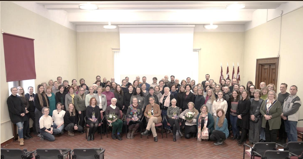
Latvijas Restauratoru biedrības biedri kopsapulcē, Latvijas Kara muzejā.

Tiešām milzīgs darbs, bieži vien – neredzamais, jo Dita nav liela runātāja par saviem paveiktajiem darbiem un ar tiem daudz nelielās, tomēr viņas ieguldījums ir nozīmīgs.